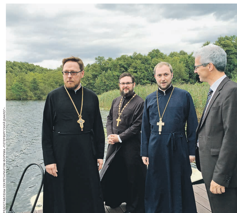
2014 год. В перерыве берлинского заседания рабочей группы «Церкви в Европе»