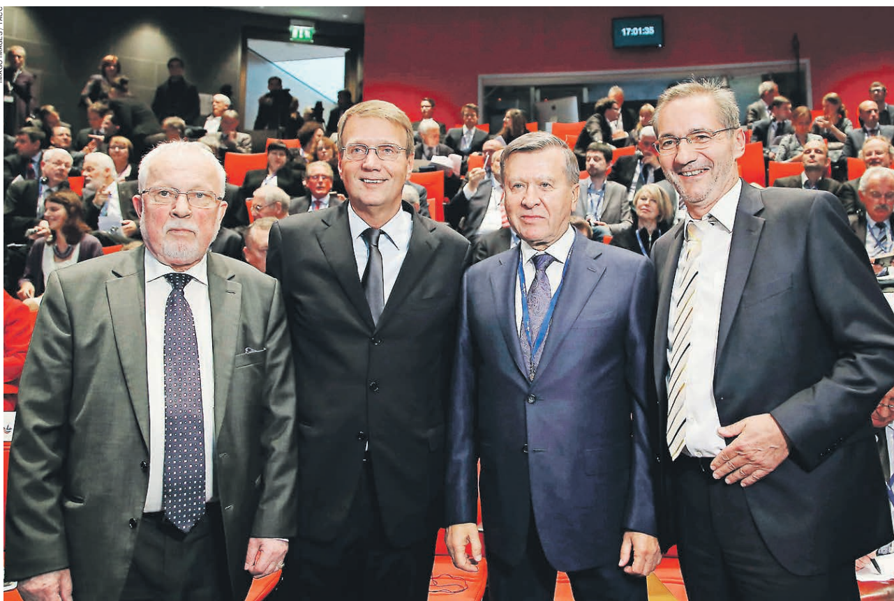
2015 год. В перерыве можно и сфотографироваться. Бывший и нынешний сопредседатели форума с немецкой стороны Лотар де Мезьер и Рональд Поффала, российский сопредседатель Виктор Зубков и руководитель «Потсдамских встреч» Маттиас Платцек