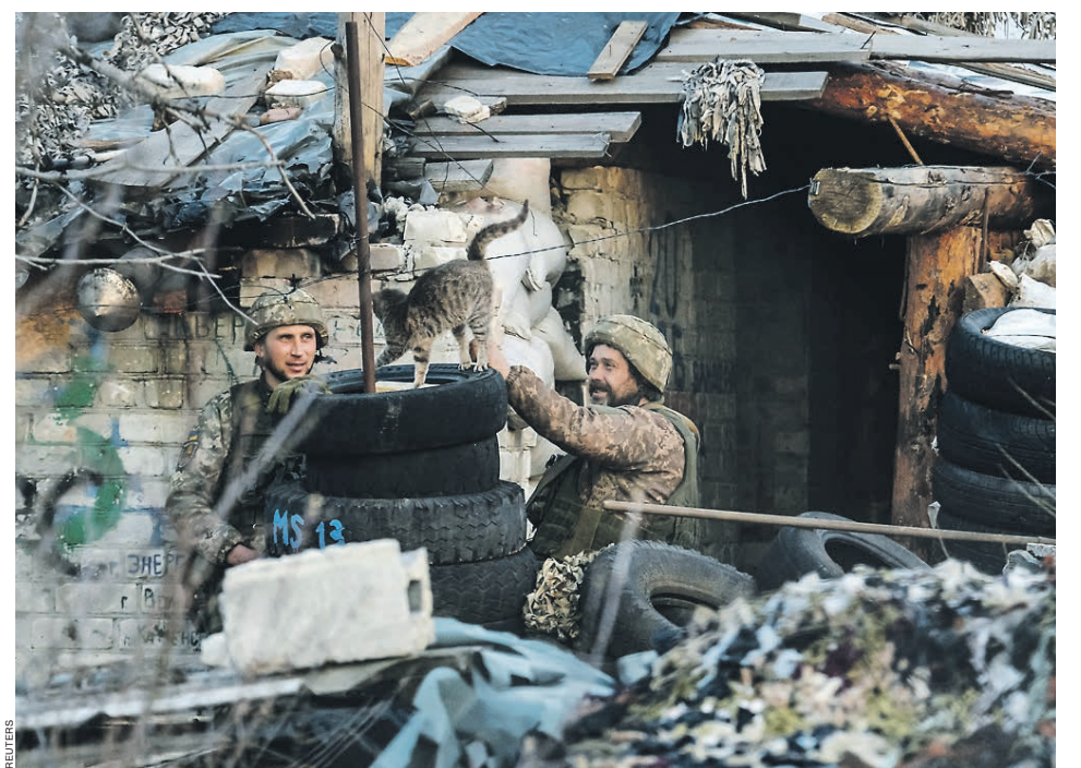
Апрель 2021-го. На украинских позициях в Донецкой области. Солдатам хочется мира

Киев переподтвердил свои июльские обязательства только в апреле. А после это-