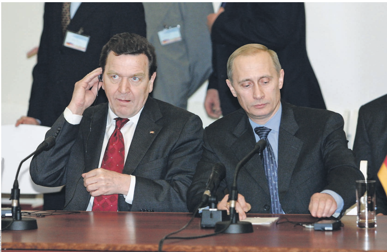
Канцлер ФРГ Герхард Шрёдер и президент РФ Владимир Путин стали соавторами появления в апреле 2001 года форума «Петербургский диалог»

В 2001 году на заре деятельности Форума работа велась в пяти рабочих группах: «Политика и гражданское общество», «Экономика и бизнес», «Наука и образование», «Культура», «Средства массовой информации». С течением времени менялись потребности общества, а следовательно, и направления работы Форума, но цели всегда оставались неизменными: содействие взаимопониманию между Россией и Германией, углубление взаимного сотрудничества во всех сферах жизни, противодействие предрассудкам, мешающим восприятию другой страны.