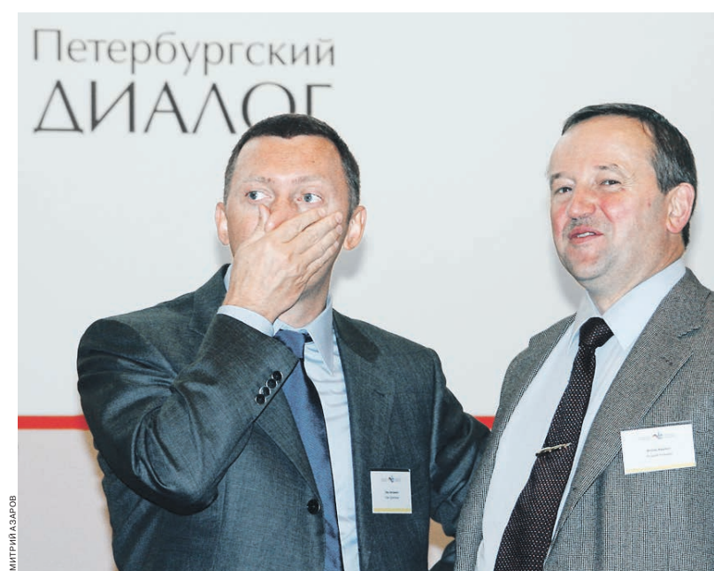
2006 год. Олег Дерипаска («Русал») и Андрей Казьмин (Сбербанк) в перерыве экономической сессии «Петербургского диалога»