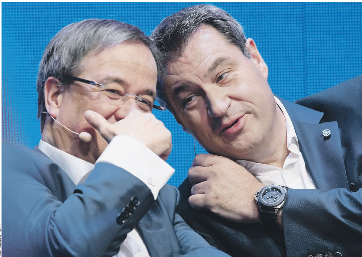
Армин Лашет и Маркус Зёдер совсем не ведут себя как ненавидящие друг друга конкуренты

После негативного опыта с кандидатом-женщиной из Министерства обороны схватка за лидерство в ХДС развернулась между тремя мужчинами-юристами из Северного Рейна—Вестфалии. Симпатии большинства из 1001 делегата съезда ХДС получил Армин Лашет, победа которого во многом была обеспечена