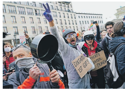
Всех — на второй год. Как Германия переживает пандемию стр. 5