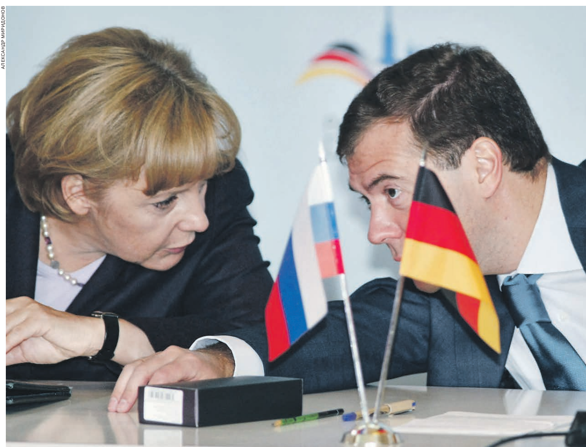
2008 год. Канцлер ФРГ Ангела Меркель и президент РФ Дмитрий Медведев на заседании форума в Санкт-Петербурге