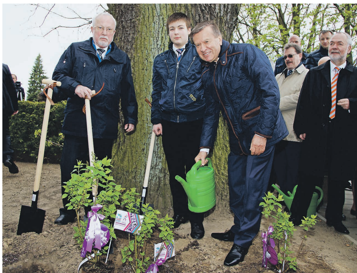
2015 год. 70-я годовщина битвы на Зееловских высотах. Деревья памяти от сопредседателей форума