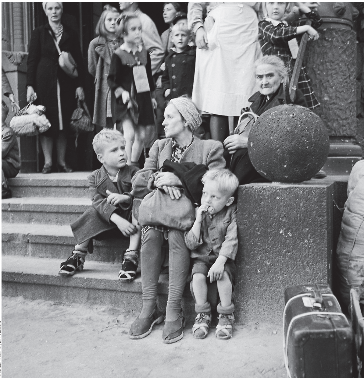
В 1945-м немцы по-настоящему узнали, что такое трагедия войны

Происходившее на территории Рейха в месяцы, оставшиеся до безусловной капитуляции, имело противоречивую природу: нарастающая усталость немецкого гражданского населения от войны сочеталась с ощущением «последних сражений», навязанным пропагандой — ожесточеннее всего они велись на востоке Германии. Треть людских потерь вермахта за все время Второй мировой войны приходится именно на послед-