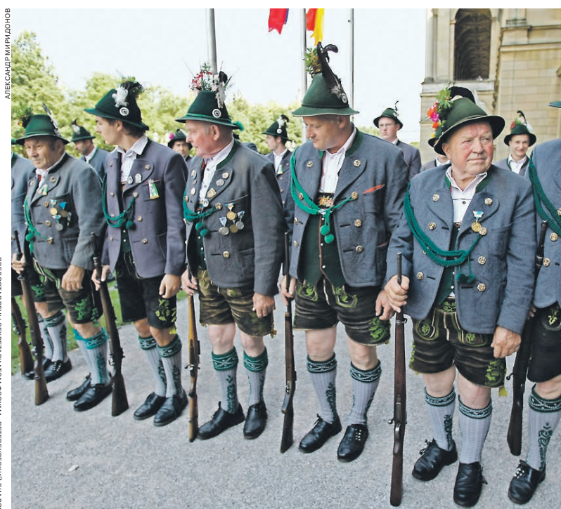
2009 год. Баварцы открывают форум в Мюнхене