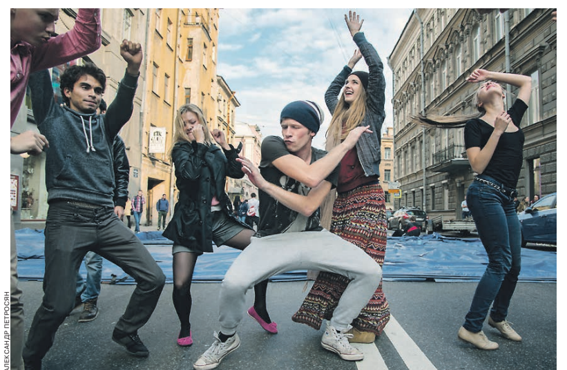
Танцы новые, а цели и ценности во многом новые

Говоря о своих политических взглядах, до трети опрошенных (28%) назвали их социал-демократическими, еще 16% относят себя к русским националистам и 12% — к либералам. При этом, впрочем, 60% отметили, что не считают себя разбирающимися ни в политике, ни в политических идеологиях. Это, по мнению авторов доклада, приводит к тому, что ориентации на предпочтительные для России модели государственного или политического устройства у российской молодежи являются «смутными и не очень выраженными». Около половины опрошенных (47%) считают, что оптимальной моделью социально-политической системы для РФ является демократия, сопоставимая доля говорит о необходимости наличия в стране оппозиции (51%). Но, хотя большинство (71%) заявляет о неприятии авторитарных методов управления, использование сило-