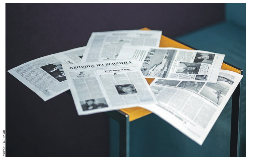
Полосы газеты «Депеша из Берлина», выпущенной немецкими журналистами специально к юбилею «отца перестройки»