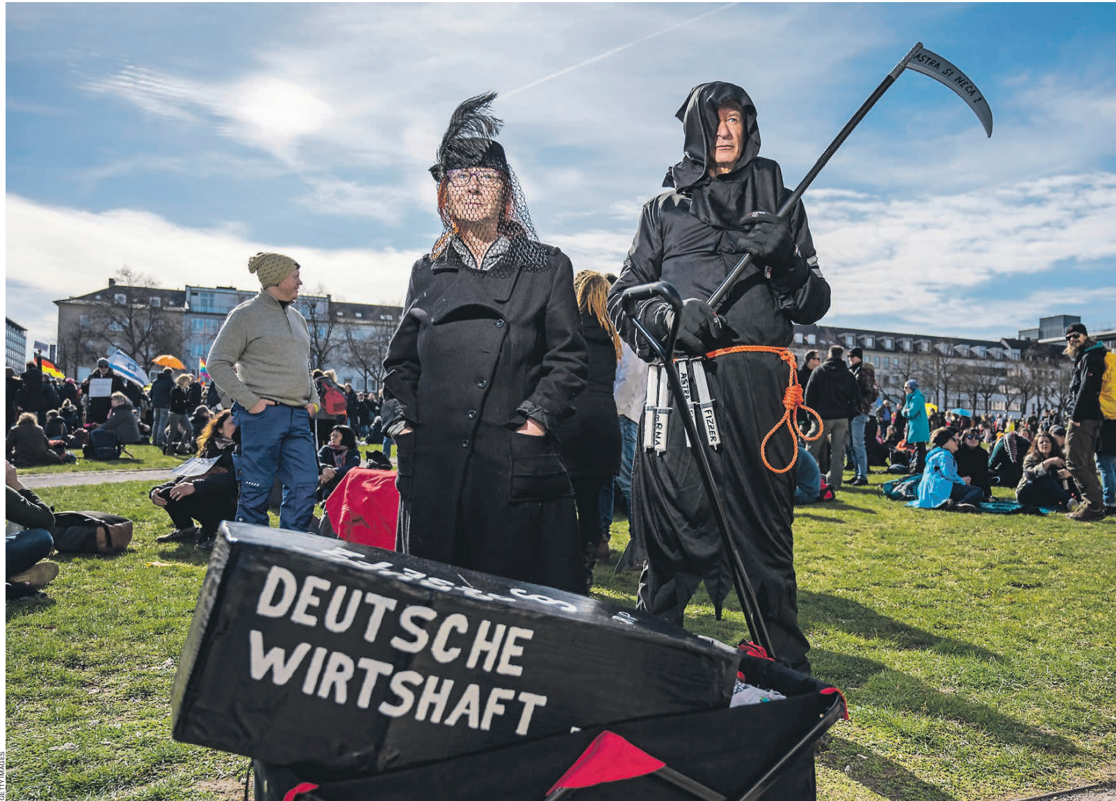
Протестующим кажется, будто COVID убивает немцев, а карантин — немецкую экономику

Однако смертность взлетела до 400 человек в сутки, и 16 декабря