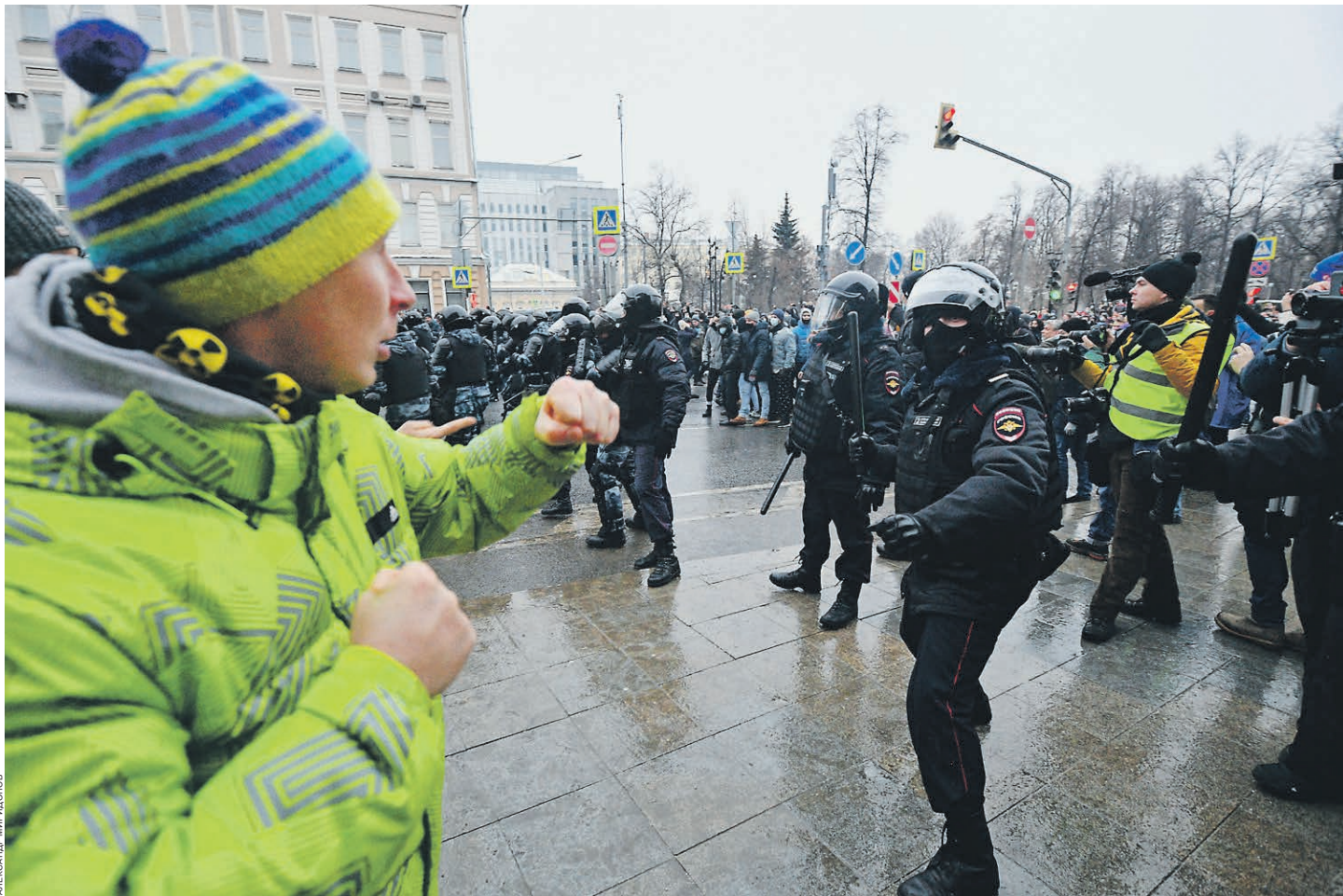
Противостояние и протесты в России вызвали дискуссию в немецком обществе

— А потом их арестовывают. — Да, потом их арестовывают, но они продолжают идти своим путем. Думаю, именно это решающий фактор, который изменился. Это можно увидеть в социальных сетях, а также в том, как это обсуждается в российских средствах массовой информации. Об этом говорят, это ни в коем случае не замал-