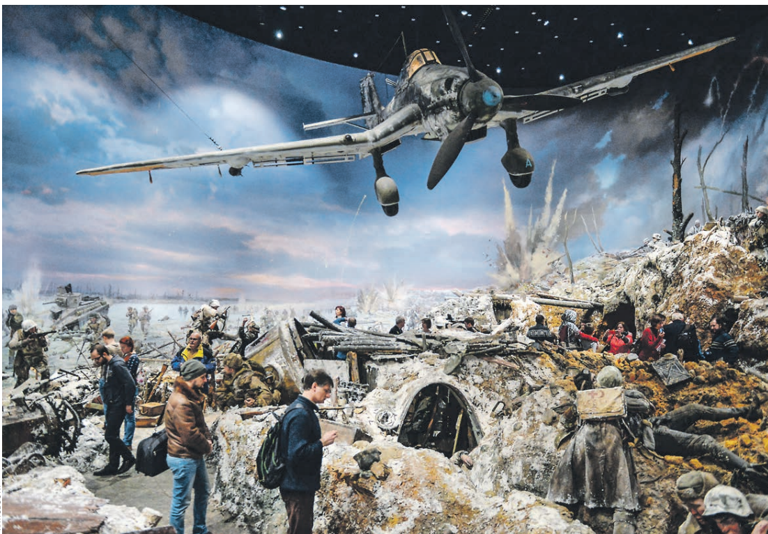
Участники российско-германского молодежного обмена смогли посетить экспозицию панорамы битвы за Ленинград

Санкт-Петербург. Хмурый октябрьский вечер. Вымокшие до нитки под проливным дождем участники «Гуманитарного жеста» проходили игровой квест по поиску в современном городе символов Ленинградской блокады. Вот уже прочитана афиша филармонии, в которой в 1942-м была исполнена знаменитая Седьмая симфония Шостаковича, найдено место на Фонтанке, где Ленинградцы брали воду, сделано множество фотографий. В путеводном листе еще остается много мест, но принято решение прервать мероприятие досрочно — бу-