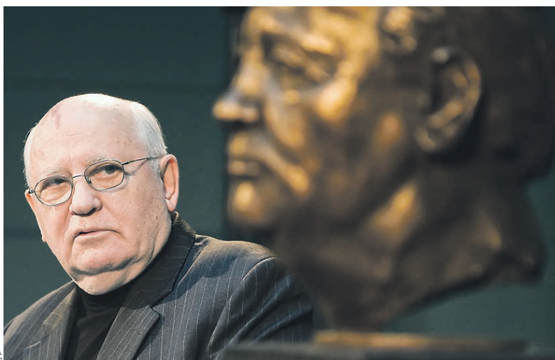
В девяносто Михаил Горбачев воспринимается многими как памятник самому себе