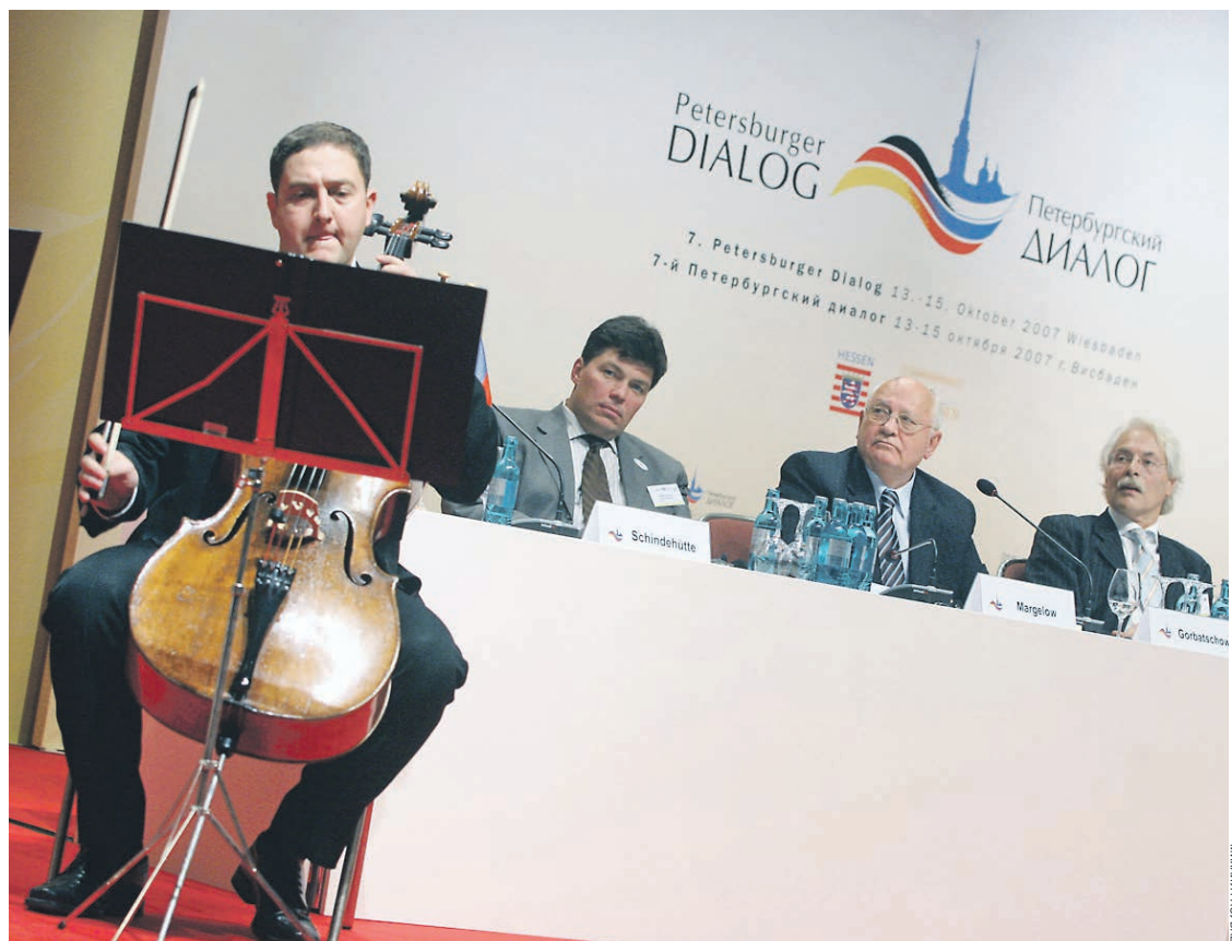
2007 год. Для Михаила Горбачева (в центре) в годы его сопредседательства «Петербургский диалог» был просто музыкой

Форум «Петербургский диалог» — это не только конференции и круглые столы. За 20 лет всем, кто прошел через участие в рабочих группах форума, открылись люди и страны — Россия и Германия. Спор, познание, веселье — все это сопровождает встречи и поездки. Этот фоторепортаж — попытка рассказать о неформальных 20 годах «Петербургского диалога».