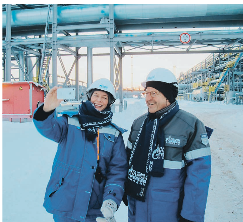
2014 год. Полуостров Ямал. «Газпром» пригласил заседание рабочей группы по экономике на свои объекты